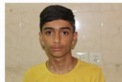
سبحان نیک آئین