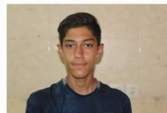
عرفان علی بیگی بنی